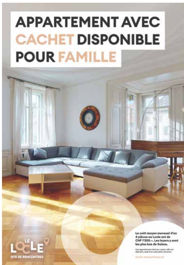
Un des visuels de la campagne «Le Locle, site de rencontres» lancé en mars.

En mars dernier, une campagne d'affichage a été déployée à travers une vaste partie du territoire neuchâtelais, mais surtout à l'extérieur du canton comme à Saint-Imier, Biemme, Yverdon et Morat. Elle mettait en avant les atouts du Locle à travers des visuels simples et des textes courts par exemple: «Site culturel d'exception accueille petits et grands explorateurs». Conçue pour éveiller la curiosité, elle a été complétée par une campagne radio sur les ondes de RJB, RTN et RFJ.