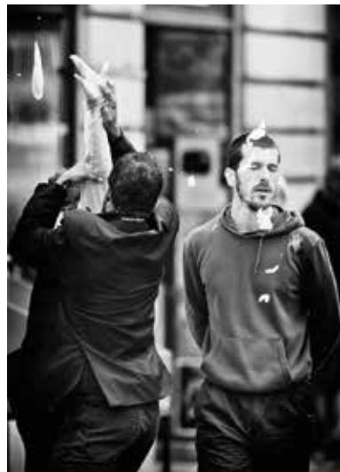
Splatsch!, du Collectif Les Lents.