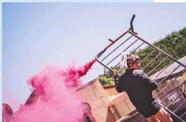
Terrain Vague met les barrières à la fête!